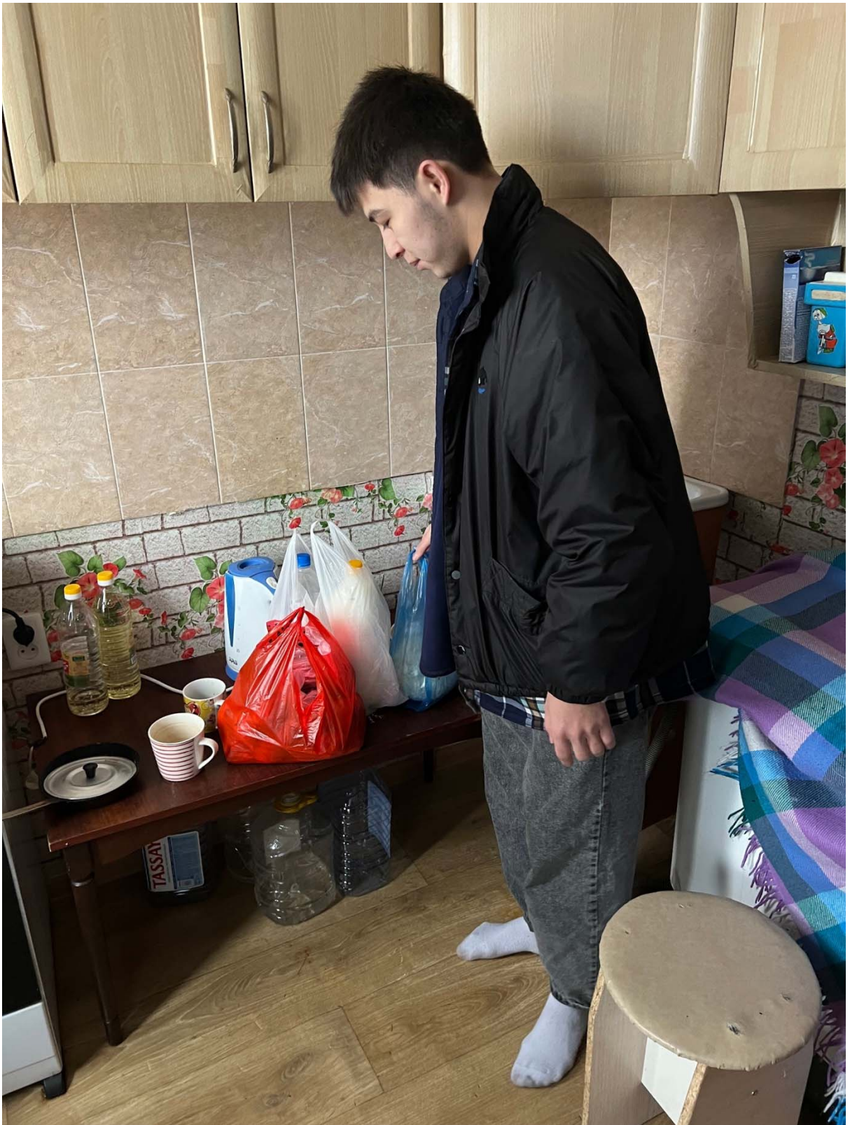
В гостях у девушки сироты с грудным ребенком.